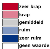
Afbeelding 2: Spanningsindicator Nederland 2e kwartaal 2023